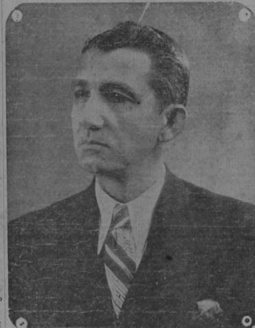
Licenciado Don LEON CORTES CASTRO