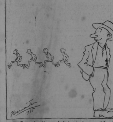
Por qué se llaman de la izquierda esos eh? — Será porque con la zurda es que se hacen las chanchadas y las cosas inútiles!

"El Ala izquierda hizo acto de presencia para protestar de la extradición de un vulgar indiciado por estafa."